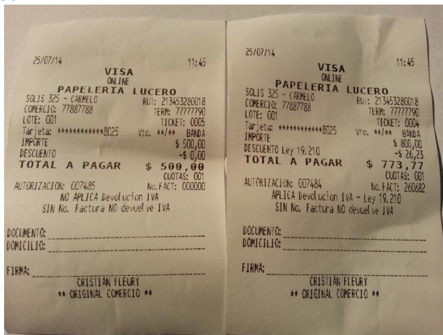
Voucher NO Aplica Ley 19210